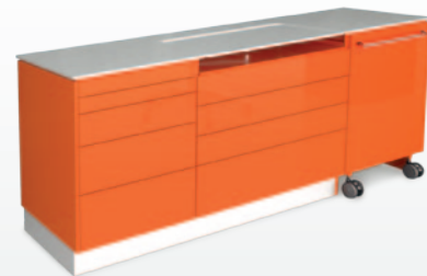
Version CB: meuble jusqu'au sol, proposé avec cart S_elect. CB Linie: Zusammenstellung mit Sockel, hier mit fahrbahrem Element S_elect.

S_tray kann in allen Saratoga Linien, die einen Schrank von 80cm haben, eingebaut werden. Wie bei allen anderen Saratoga Möbeln, kann die ganze Zusammenstellung auf persönliche Bedürfnisse, nach verfügbarem Raum und Kundenwunsch hergestellt werden.