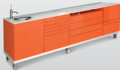
Version CF: meuble sur pied, alliant robustesse et hygiène. CF Linie: Zusammenstellung mit Füßen, die Festigkeit und Hygiene kombiniert.