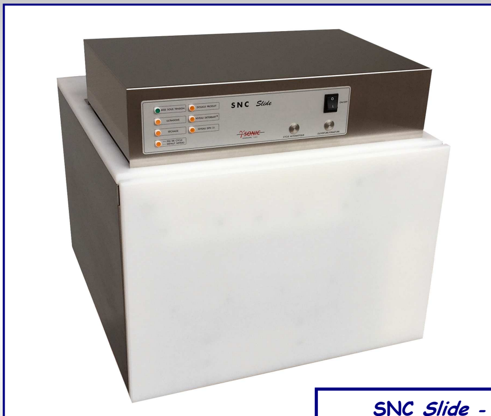
SNC Slide - Version Tiroir Ouverture / Fermeture du Tiroir automatisée

Appareil Automatique Incorporable sous plan de travail