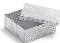
Corbeille pour fraises et petits ustensiles