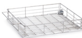
Panier de chargement standard