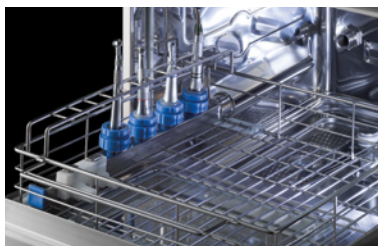
Support avec portoir à pipettes