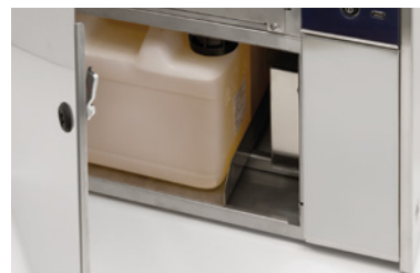
Système de distribution de liquide chimique