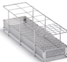
Élément pour instruments en position verticale