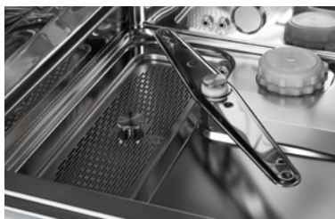
Système de lavage par injection