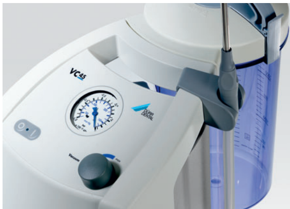
Dépression maximale allant jusqu'à 910 mbar