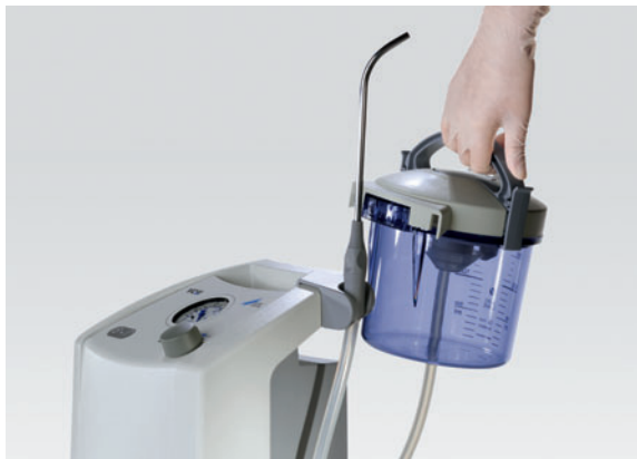
Retrait du bocal à sécrétion

Pendant l'opération, le patient est l'objet de toute la concentration. C'est pourquoi l'équipe soignante doit pouvoir se fier à la performance des systèmes et à leur parfait état de fonctionnement. L'unité d'aspiration chirurgicale à réglage continu VC 45 satisfait à toutes les exigences chirurgicales grâce à son débit d'aspiration de 45 l/min et une dépression élevée constante allant jusqu'à 910 mbar.